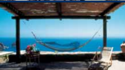
CLUB LEVANTE - Pantelleria