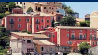
LA LOCANDA DELLE DONNE MONACHE - Maratea