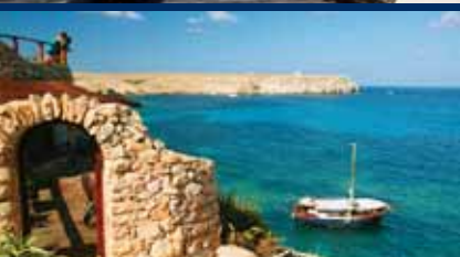
IL GATTOPARDO DI LAMPEDUSA - Lampedusa