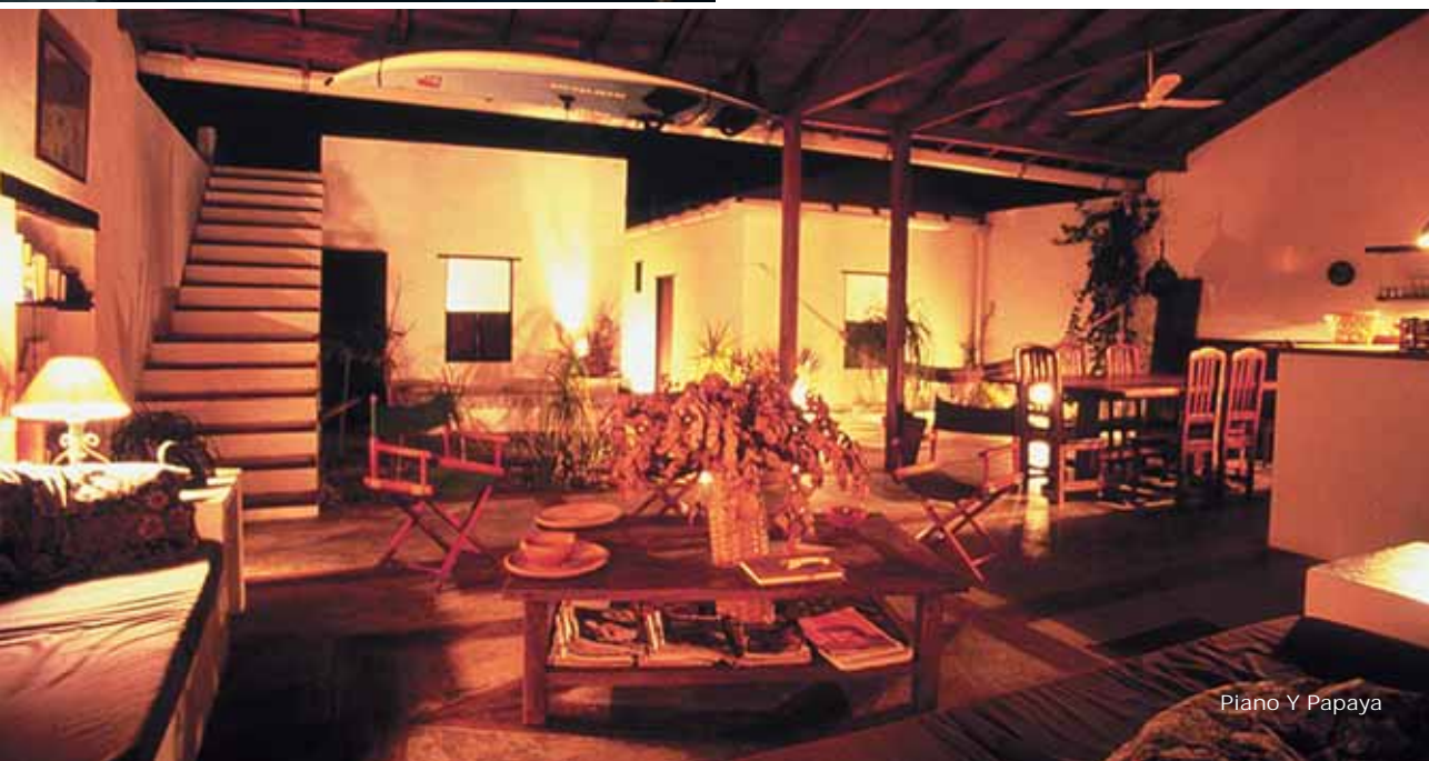
Piano Y Papaya

La gestione italiana garantisce un servizio di ottimo livello ed una cucina di qualità eccellente.