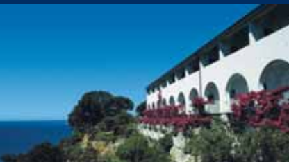
HOTEL SANTAVENERE - Maratea