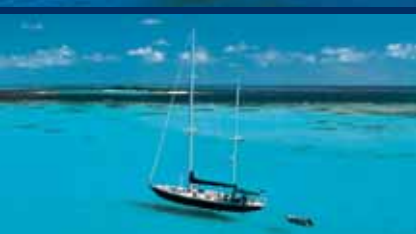
BARCHE CON E SENZA EQUIPAGGIO