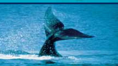
NATURA: Galapagos, Patagonia, Artide, Antartide