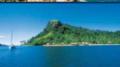
OCEANO INDIANO: Zanzibar, Cubadak (Indonesia)